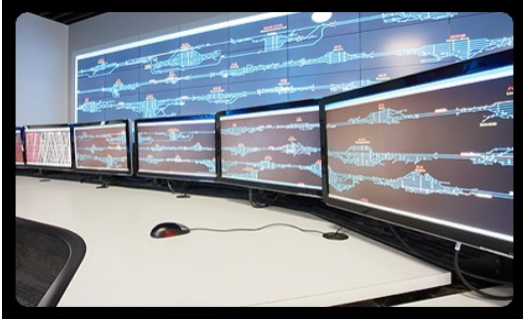
Videowall LCD LED