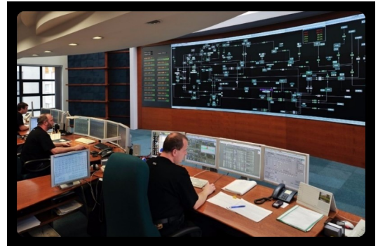
Videowall de Retroprojeção DLP LED