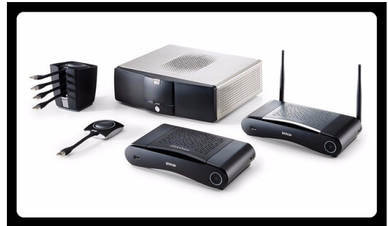
Sistemas de Colaboração