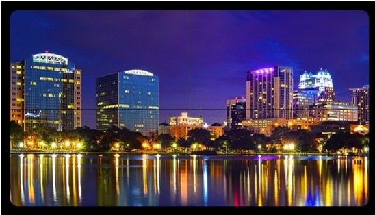
Monitor profissional de LCD