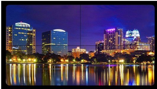
Monitor profissional de LCD